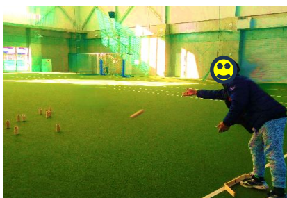
狙いを定めて、スキttlを 投げます！