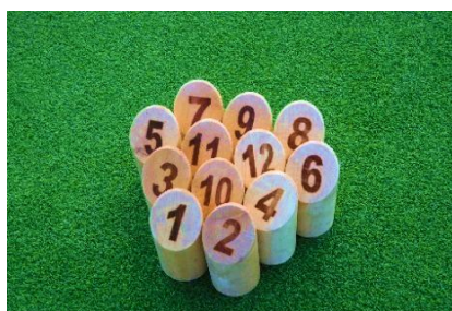
スタート時のモルック

モルックは「モルック」という木の棒を投げて「スキttl」と呼ばれる12本のピンを倒し、点数を競うゲームです。2チームで対戦し先に50点ちょうどを取ったチームが勝ちです。デイナイトケアで市の屋内競技場へ行き、人工芝の上で熱い戦いを繰り広げました🔥