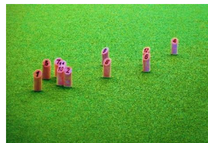
ゲーム途中のモルック