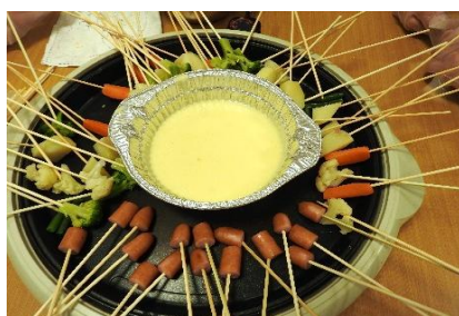
とろ～り♡チーズフォンデュ