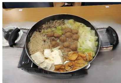
皆で囲むお鍋は美味しいね～♪