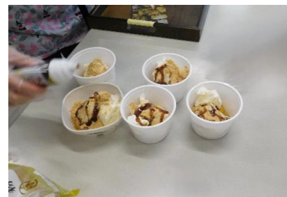
かぼちゃ白玉団子にアイス きな粉、黒蜜をトッピング☆☆