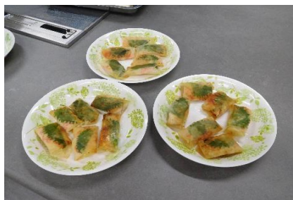
揚げない海鮮春巻き、ヘルシー！