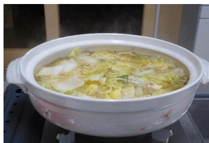
ちゃんこ鍋、ドスコイ！！