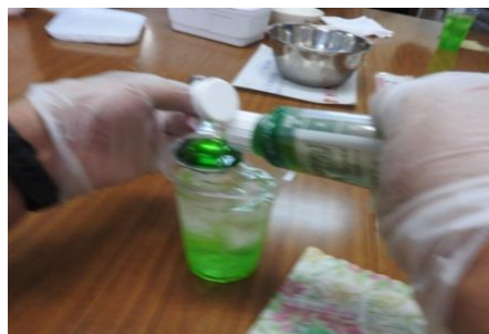
シロップをいれて～

流行のレトロ喫茶の人気メニュー！メロンソーダフロート・コーラフロート・コーヒーフロートを作ってみました。まずはメロンソーダを作り、次にアイスを入れるのですが、初めてディッシャーという器具を使ってアイスを入れてみました。お店の店員さんのように、まあるくきれいにすくうのは難しかったです。デイケア喫茶でのフロートはとてもおいしかったです♪