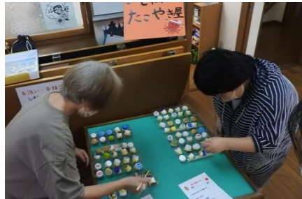
何個ひっくり返せるかな？

9月は十和田市や近隣市町村で次々と秋祭りが開催されます。この日は秋祭りにちなんで、たこやき屋台のたこやきひっくり返しゲームと、みこしに見立ててタワーを作るゲームを行いました。皆さん真剣な表情で競争していました。そして、翌日の航空祭にちなんで紙飛行機を作ってどれだけ飛ばせるか競争しました！遠くに飛ばすように、自分なりの紙飛行機を作るのも楽しかったです！