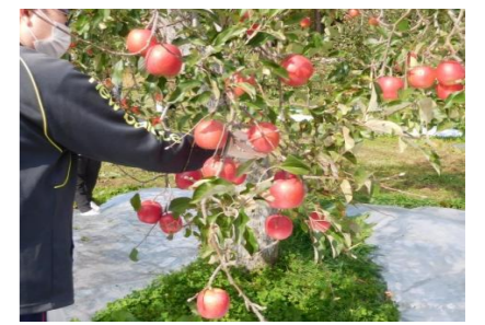
これがおいしそう ■