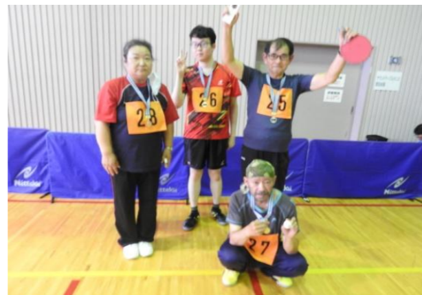
メダル獲得 おめでとう！！