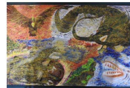
作品名 「永遠（とわ）より絆」