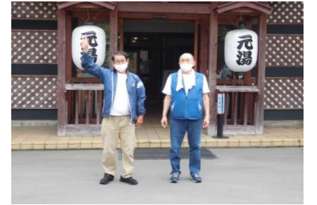
#仲良し男子の2人旅