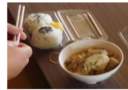
自慢のおにぎりと芋煮 ■