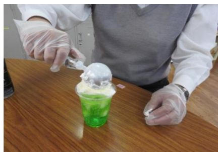
アイスはそーっとね(*^^*)