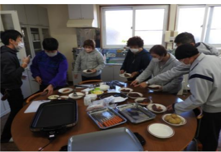
キムチ…のせてみる？