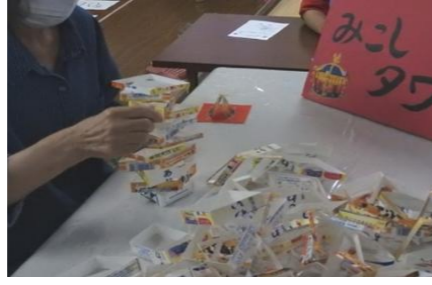
高く！高く！慎重にね(^_^)